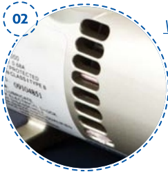
02 Very low-noise level (<60dBA) Nivel de sonido muy bajo (<60dBA)