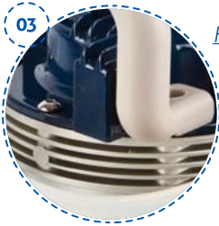
03 High-performance filter Filtro de alto rendimiento